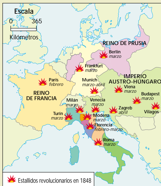
Mapa de las revoluciones de 1848.

Las pretensiones de Austria, Prusia y Rusia en el este europeo se resolvieron con la creación del pequeño reino de Polonia –bajo la soberanía del zar de Rusia– y el reparto de territorios entre Austria y Prusia. Austria recibió el norte de Italia, Bosnia y Montenegro, y Prusia amplió su territorio en Renania. Alrededor de Francia se crearon pequeños Estados: el reino de los Países Bajos, la Confederación Helvética y el reino de Piomonte-Cerdeña.